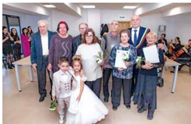
Район Надежда. В сградата на районната администрация бяха подновени брачните обети на двойки, чествачи 50 години съвместен семеен живот – на стр. 2