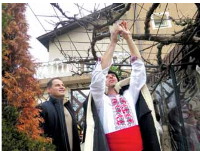
Район Нови Искър, с. Доброславци