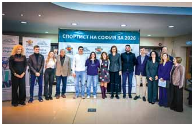
За трета поредна година София отличи най-добрите си спортисти – на стр. 10