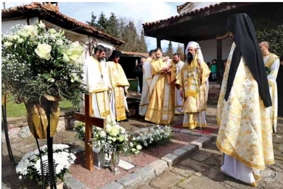
Община Горна Малина, с. Байлово. Българският патриарх и Софийски митрополит Даниил отслужи заупокойна молитва за годишнината от земната кончина на Дядо Добри – на стр. 12