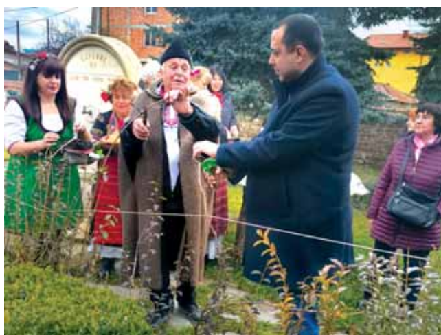
Район Връбница, с. Мрамор