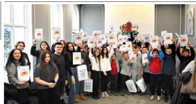
Община Елин Пелин. Наградиха победителите в конкурса за есе и разказ на тема „Доброто започва от мен“ – на стр. 6