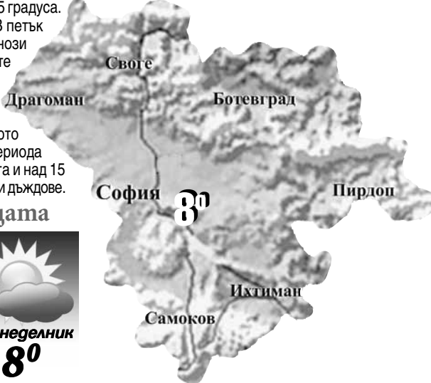
Средна температура за областта

Луната е във фаза нарастващ полумесяц с осветеност на лунния диск 4%. Първа четвърт след 5 дни на 24 февруари в 14:28:59 ч. Намира се в зодиакален знак Рибите.