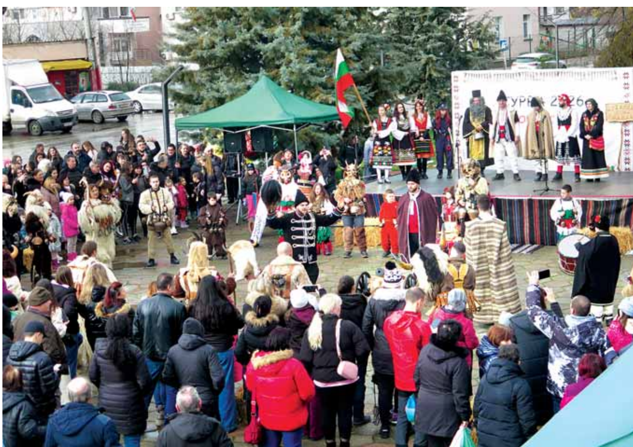
Район Нови Искър, кв. Гниляне. Звън на чанове и музикално настроение ознаменуваха празника "Сурва Нови Искър" на площада и в читалището – на стр. 3