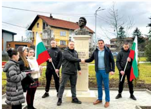
Район Нови Искър, кв. Славовци. В квартала тържествено откриха паметник на Васил Левски – на стр. 3