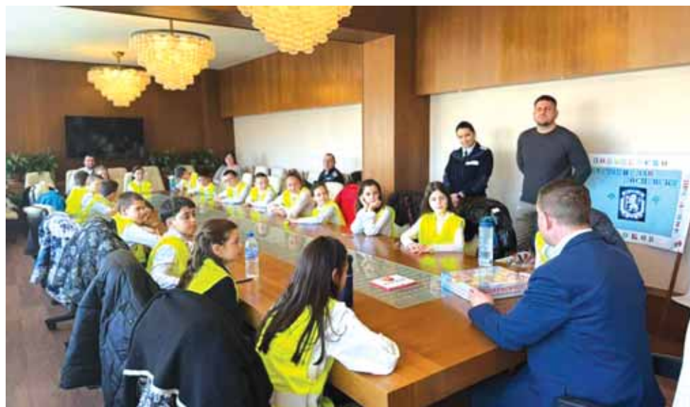
Община Самоков. Учениците от Полицейската детска академия гостуваха на кмета и общинската администрация – на стр. 6